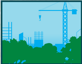
Colli a darnio cynefinoedd