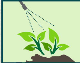
Defnydd cyson a diangen o blaladdwyr