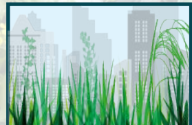
Y llywodraeth, cymunedau ac unigolion yn cydweithio i greu Rhwydwaith Adfer Natur