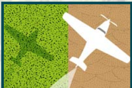
Rhaid i'r llywodraeth bennu targedau lleihau plaladdwyr uchelgeisiol